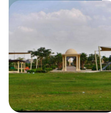
حدائق وممرات مشاة