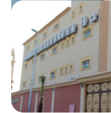
مجتمعات مدارس للبنين والبنات