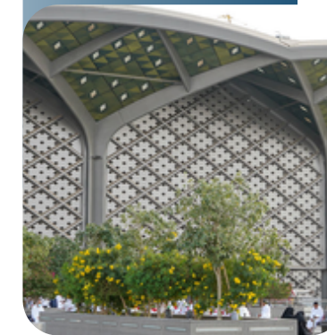
محطة قطار الحرمين