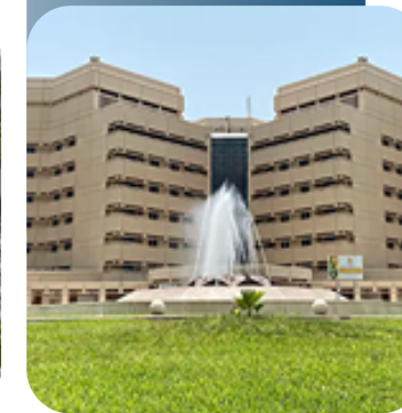
جامعة الملك عبدالعزيز