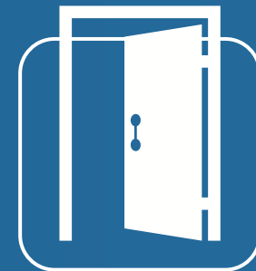
أبواب WPC WPC Doors