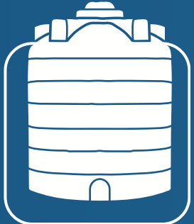
خزانات مياه Water Tanks