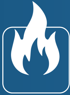
نظام إطفاء الحريق Fire Extinguishing System