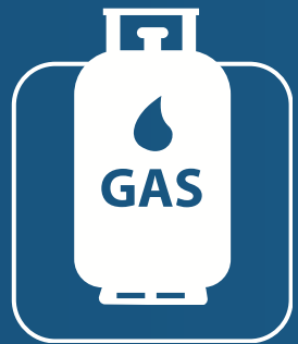
غاز مركزي Central Gas System