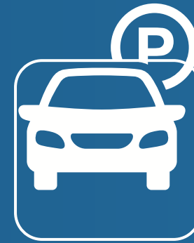
موقف خاصة Parking Space