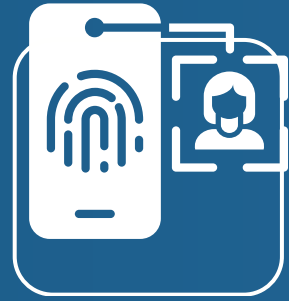
دخول ذكي Electronic Security