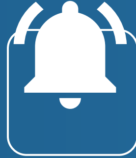
نظام إنذار الحريق Fire Alarm System