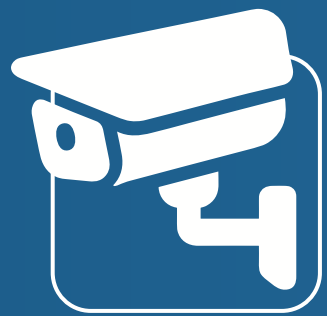
كاميرات مراقبة Surveillance Cameras